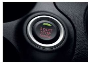
ONE TOUCH START SYSTEM ปุ่มสตาร์ท และดับเครื่องยนต์ สะดวกสบายแค่ปลายนิ้วสัมผัส ทำงานร่วมกับระบบป้องกันการโจรกรรม (เฉพาะรุ่น SMART)