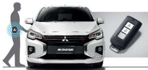
KEYLESS OPERATION SYSTEM กุญแจอัจฉริยะ KOS (เฉพาะรุ่น SMART)