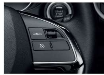
CRUISE CONTROL SYSTEM สะดวกสบายมากยิ่งขึ้น เมื่อต้องขับขีทางไกล ด้วยระบบล็อกความเร็วบนพวงมาลัย (เฉพาะรุ่น SMART)